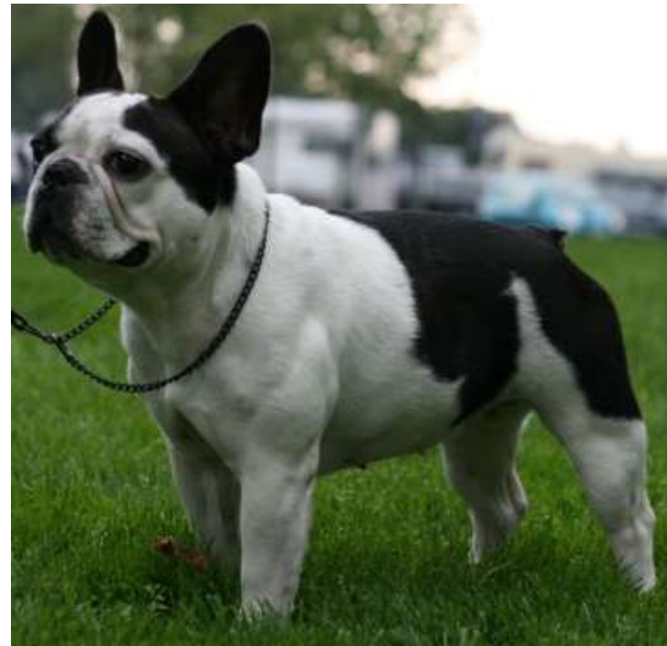
erinomaisen yleisvaikutelman omaava narttu