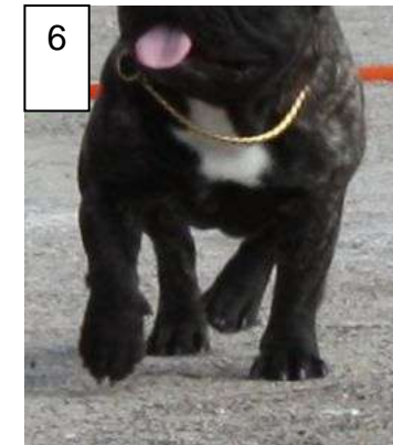
Kuva 4: Selkälinja kestää liikkeessä ja hyvä askelpituus. Jalat mahtuvat liikkumaan rungon alla kiertymättä ulos tai sisään Kuva 5: Lyhyt töpöttävä askellus, lyhyestä rungosta johtuen takajalkojen on hakeuduttava ulkouralle mahtuakseen liikkumaan Kuva 6: Katsottaessa liikkeitä suoraan edestä, tulee takajalkojen näkyä etujalkojen sisä- EI ulkopuolella

Valitettavan paljon näkee niin sanotulla ”töpöttävällä” askeleella liikkuvia yksilöitä. Ranskanbulldoginkin pitää pystyä ravaamaan suorassa linjassa ilman ongelmia.