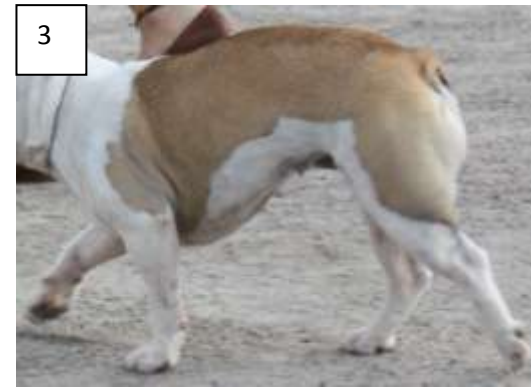
Kuva 1: Hyvä liikerata ja askelpituus Kuva 2: Hyvä liikerata ja askelpituus Kuva 3: Lyhyt takapotku, etuosa putoaa liikkeessä ja selkä köyristyy