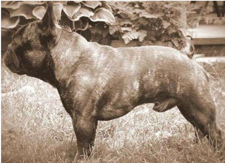
erinomaisen yleisvaikutelman omaava uros